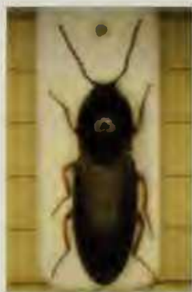
Fig. 1. Cardiophorus vestigialis Erichson, 1840; Wellin (België, prov. Luxemburg), 09.ii.2014, leg. H.Raemdonck.

Op 09.ii.2014 ontdekte ik te Wellin (prov. Luxemburg) een exemplaar van Cardiophorus vestigialis Erichson, 1840. De kever zat achter schors van een vermolmde den ( Pinus ) (fig.1). Dit kniptorretje is 7,5 mm lang. Kop, sprieten en het bolle halsschild zijn zwart. Dekschilden eveneens zwart maar ook fijn behaard. Poten roodbruin met donkere tarsen. In het werk van Jeuniaux (1996: 55) wordt deze kever vermeld als Cardiophorus erichsoni du Buysson, 1901 maar deze naam slaat eerder op een verouderd synoniem (Lohse 1979: 18). C. vestigialis behoort met de 10 andere Belgische Cardiophorus -soorten tot de onderfamilie der Cardiophorinae die gekenmerkt worden door hun hartvormig schildje (Jeuniaux 1996: 55).